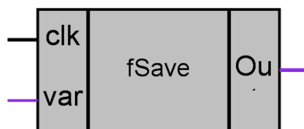
Рисунок 1 – Условное обозначение