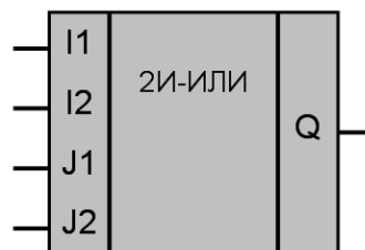
Рисунок 1 – Условное обозначение