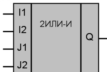
Рисунок 1 – Условное обозначение