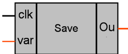
Рисунок 1 – Условное обозначение